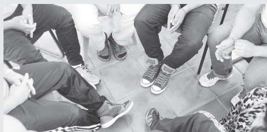
Los talleres psicosociales grupales buscan propiciar el desarrollo de las potencialidades particulares de cada persona, a nivel individual y colectivo.

Intervención Familiar: Taller multifamiliar, efectuado por psicólogo trabajador social, con participación de usuarios, familiares o personas de referencia, teniendo como fin mejorar la comunicación, favorecer el reconocimiento y desarrollo de roles, entre otros.