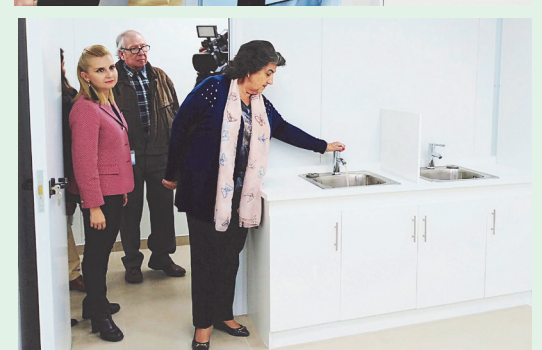
También aumentaron las prestaciones médicas para cubrir la demanda de los usuarios.