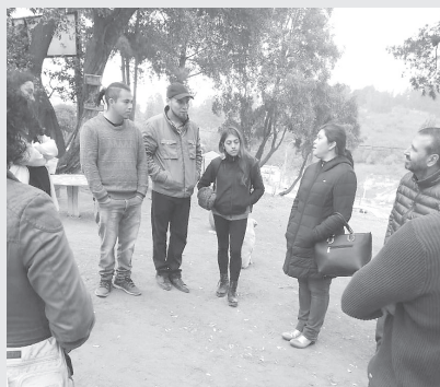
Integrantes de Rengankó recibieron a los Encargados Comunales de Promoción de Salud de la provincia de Valparaíso.

Se informó que la visita forma parte de una nueva modalidad de trabajo a nivel provincial orientada a difundir hacia otras comunas las Buenas Prácticas en salud, para lo cual se organiza una salida a terreno mensual, visitando desde Casablanca hasta Puchuncaví, con la intención de evaluar las condiciones de su implementación y replicar los proyectos innovadores en cada una de las comunas.