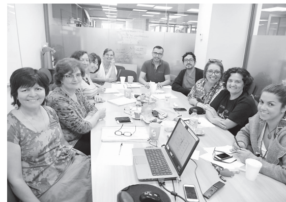
Profesionales de salud del país elaboran Orientaciones Técnicas para Medicina Complementaria

forma segura, de calidad y que permita la investigación en esta área”, precisó.