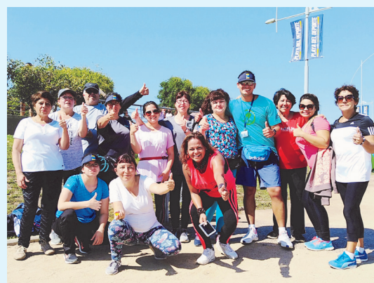
Grupo del Programa VIDA SANA adhirió al Día Internacional de la Actividad Física