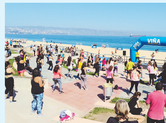
El municipio organizó diversas actividades gratuitas para promover la actividad física