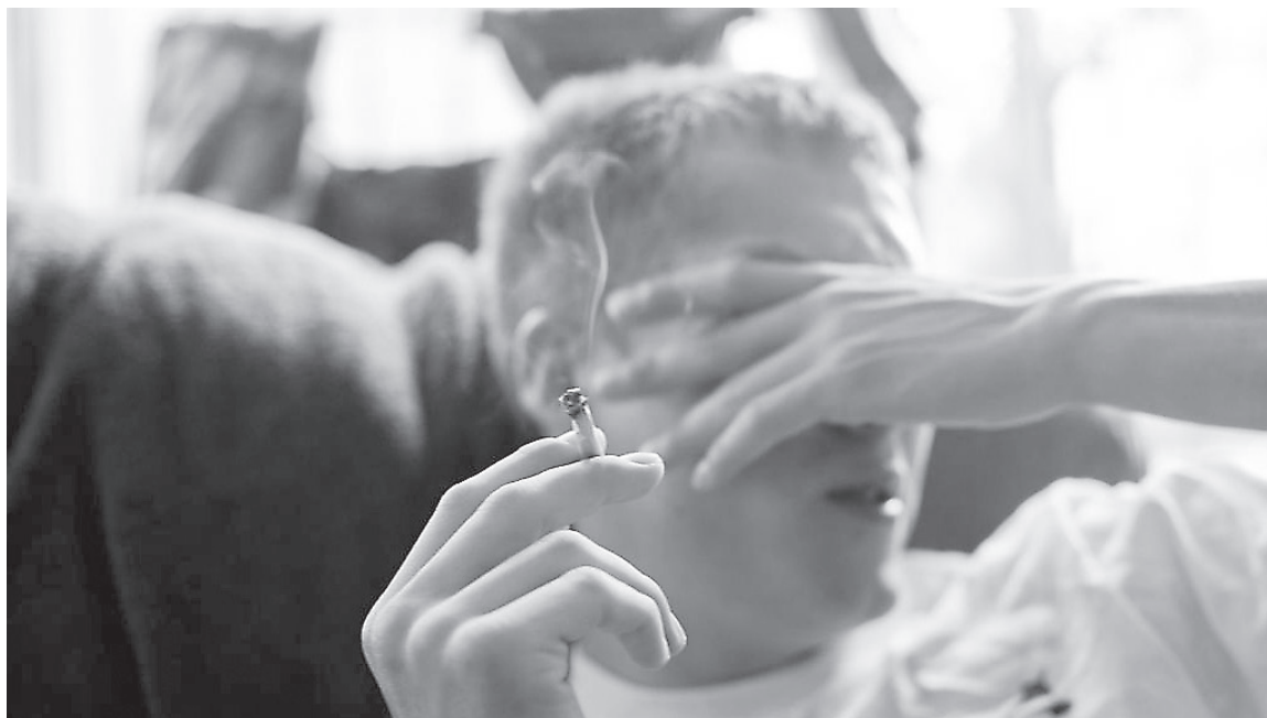
El uso prolongado de la marihuana puede gatillar depresión y trastornos psiquiátricos en la adultez, como psicosis, esquizofrenia

En cuanto al uso recreacional de la marihuana, sostuvo que “después de los 25 años cada uno asume sus riesgos, es una decisión personal”. Pero no se puede trabajar o conducir bajo el efecto de drogas que llegan al cerebro como el alcohol o la marihuana, por lo tanto el uso recreacional implica un grado de responsabilidad hacia el resto de la sociedad, para no causar daño debido a que tus facultades mentales se ven perturbadas”, precisó.