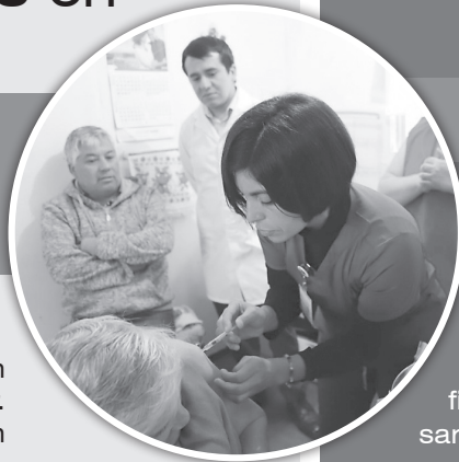
El operativo de vacunación preventiva favoreció principalmente a personas dismovilizadas adultas mayores.