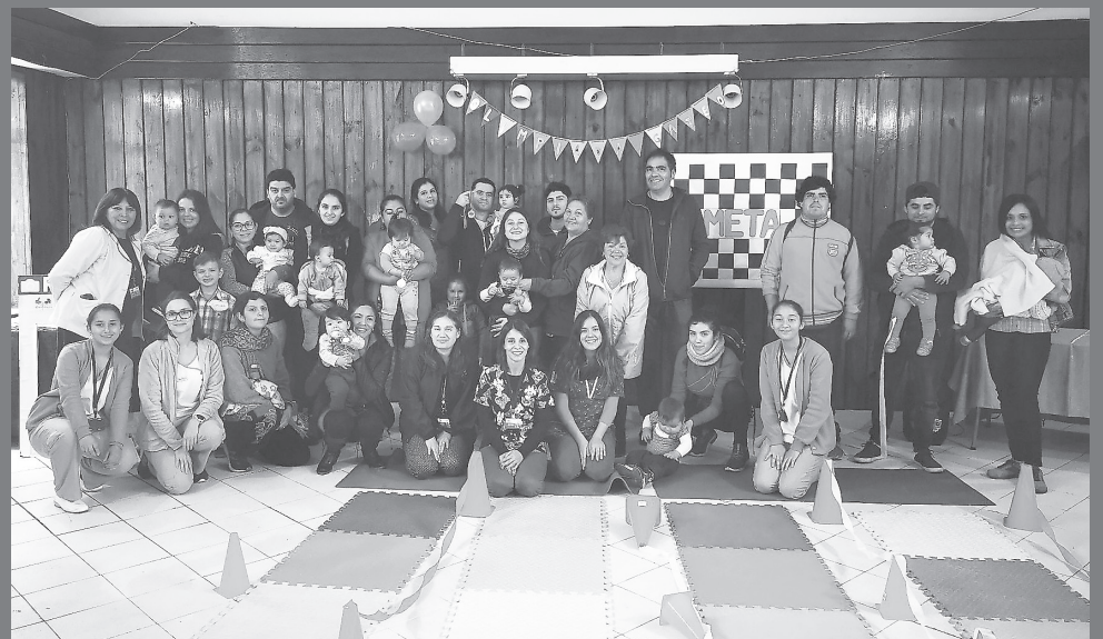
Las familias participaron con gran entusiasmo junto a sus hijos en esta instancia de promoción del desarrollo sicomotor infantil.