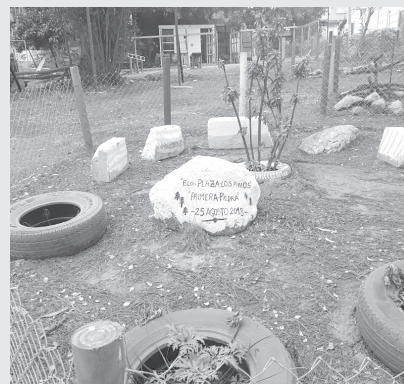
En la recuperación y mantención de la Eco Plaza la comunidad ha sido pieza clave