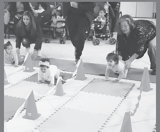
El gateo es un ejercicio muscular previo y necesario para que el bebé logre ponerse de pie