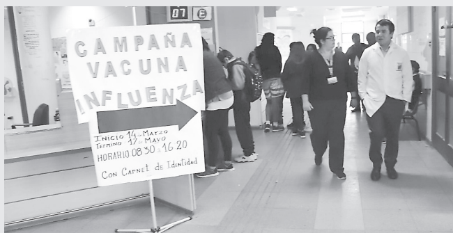
Las autoridades reiteraron que la vacuna contra la Influenza es segura y eficaz

Cabe recordar que los grupos objetivos para la vacunación contra la influenza son los adultos mayores sobre los 65 años, enfermos crónicos entre los 6 y los 64 años, niños y niñas entre los seis meses y los 5 años y también las embarazadas a partir de la semana 13 de gestación.